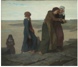
Saint-Brieuc Musée d'art et d'histoire de Saint-Brieuc La Veuve Evariste Vital Luminais