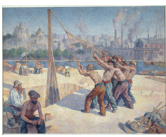
Cognac Maison du négociant / Musée d'art et d'histoire de Cognac Les Batteurs de pieux Maximilien Luce