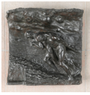
Suresnes MUS – Musée d'histoire Urbaine et Sociale de Suresnes La Glèbe Constantin Meunier, J. Peterman